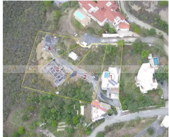
FOTOGRAFÍAS DEL TERRENO

Ave. Gómez Morin No. 100 Local N1-03 esquina con Ave. Roberto Garza Sada, Col. Carrizalejo San Pedro Garza García N.L. C.P. 66290 Tel. + 52 (81) 8218.8939 Tel. + 52 (81) 8378.6238 Email: info@gvia.mx www.gvia.mx