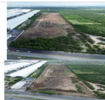
AVANCES DE OBRA / TERRACERÍAS EN PLATAFORMAS DE NAVES