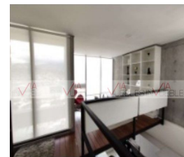
8.- Estudio en planta alta.