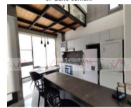
6.- Cocina, centro de lavado y antecomedor.