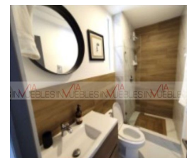
9.- Baño común.