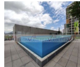
12.- Área común (alberca).