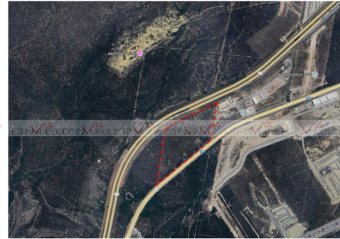
10 Hectáreas (aprox 400m x 250m)

Recámaras: 0 Baños: 0 Medios Baños: 0 Plantas: 0 Estacionamiento: 0 Antigüedad: Terreno: 10000 Mts 2 Construcción: 0 mts 2 Frente: 400 Mts Fondo: 250 Mts