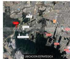
UBICACION ESTRATEGICA (Industrial / Comercial)

Terreno en Venta con Uso Industrial/Comercial ? ¡Ubicación Estratégica! Oportunidad única de inversión en una de las zonas con mayor proyección de crecimiento. El terreno cuenta con una superficie de 7.5 hectáreas (75,000 m 2 ), con un frente aproximado de 400 metros sobre el Libramiento Noroeste. Se puede subdividir desde 1 hectárea, ideal para desarrollos industriales, logísticos o comerciales de gran escala. Ubicado a un costado de Terrapark García, uno de los parques industriales más importantes de la zona, lo que lo convierte en una opción estratégica para empresas que buscan sinergia, infraestructura y crecimiento. Con acceso directo al Anillo Periférico de Monterrey (cuota y libre) y conectividad inmediata hacia Saltillo, San Luis Potosí y Laredo, EUA. Avenidas cercanas: Paseo de los Leones, Lincoln y Ruiz Cortines. Visibilidad, conectividad y ubicación privilegiada para proyectos con visión de largo plazo. El valor del metro cuadrado de una hectárea es de $2,800, de dos hectáreas $2,600 y en lotes más grandes acordamos el valor