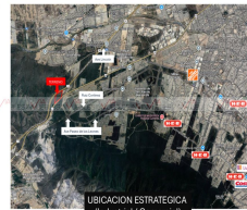
UBICACION ESTRATEGICA (Industrial / Comercial)