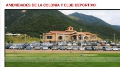
AMENIDADES DE LA COLONIA Y CLUB DEPORTIVO El costo mensual de cuotas de Herradura son los siguientes: • Residentes: $ 2.275.00 M.N.