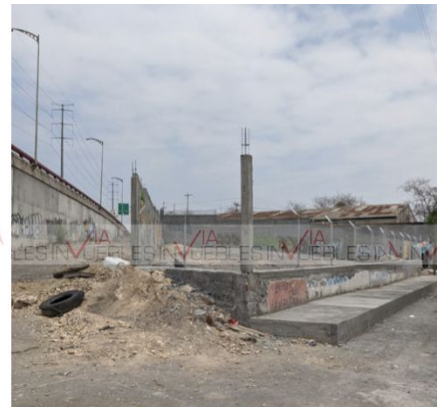
Calle de atras pendiente habilitar por municipio

Ave. Gómez Morin No. 100 Local N1-03 esquina con Ave. Roberto Garza Sada, Col. Carrizalejo San Pedro Garza García N.L. C.P. 66290 Tel. + 52 (81) 8218.8939 Tel. + 52 (81) 8378.6238 Email: info@gvia.mx www.gvia.mx