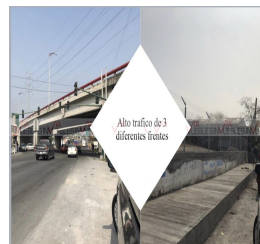
Alto trafico de 3 diferentes frentes