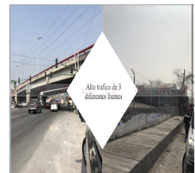
Alto trafico de 3 diferentes frentes