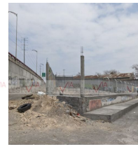
Calle de atras pendiente habilitar por municipio